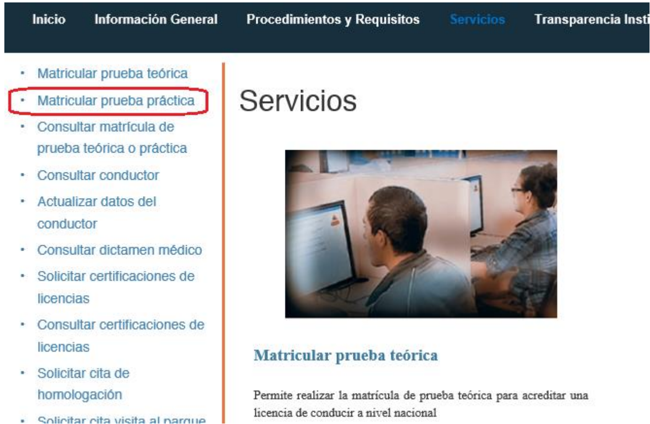
Ilustración 3. Ingreso a la prueba práctica desde menú lateral

a) Haciendo clic a la opción en el menú lateral izquierdo.