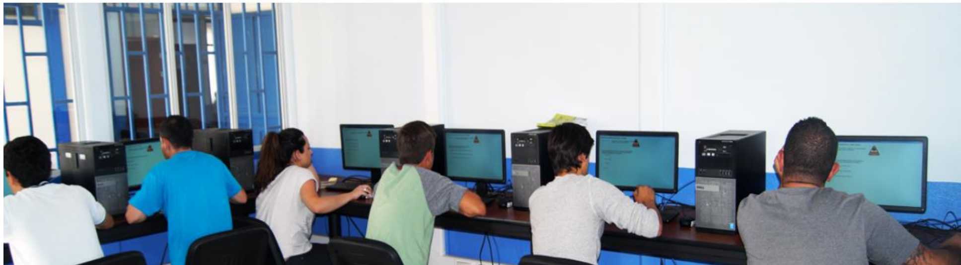
Ilustración 1. Ingreso al portal de la DGEV